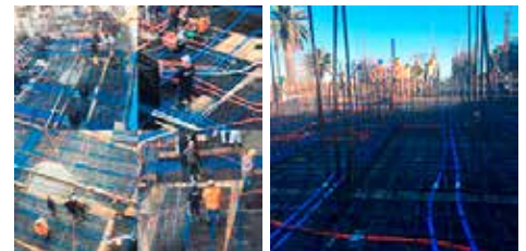
Colocación de hormigón para Losas postensadas