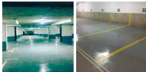
Servicios de demarcaciones