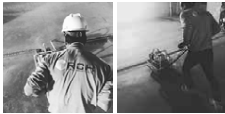
Cortes de dilatación y de aislación con sistema Soff-cut (Recomendado para radieres de bajo espesor o sometidos a maduración temprana)