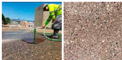
Servicio ejecución hormigón lavado