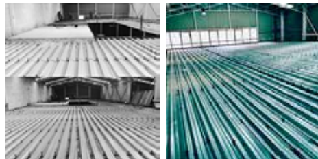
Afinado de hormigón para losas colaborantes