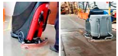
Servicios de lavado y limpieza de pisos