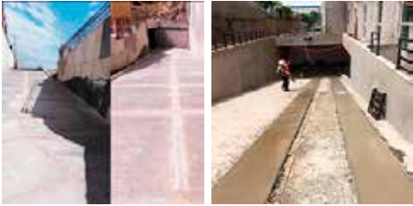
Servicio ejecución de rampas