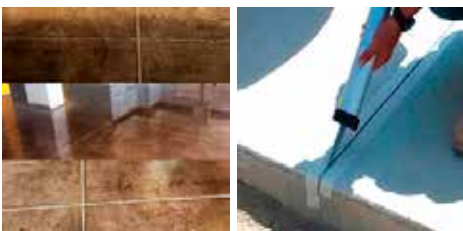
Sello de juntas de dilatación, aislación y construcción (Considera suministro de materiales y mano de obra especializada)