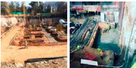
Colocación y vibrado de hormigón para fundaciones