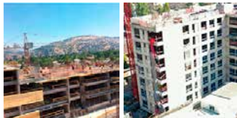
Colocación de hormigón para edificaciones en altura, servicio completo