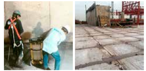
Cortes de dilatación y de aislación con disco por enfriamiento al agua (Recomendados para radieres bajo techo o de alto espesor)