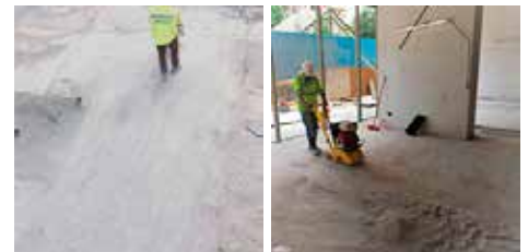
Servicio de escarificado y de retiro de pinturas y/o membranas pre-existentes