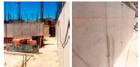
Colocación y vibrado de hormigón en muros contra terreno y dos caras