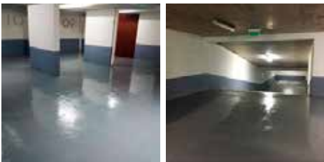
Aplicación de sello matapolvo y protector de desgaste para subterráneos (Considera suministro de materiales y mano de obra especializada)