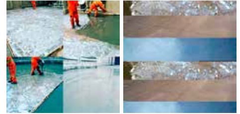
Reparación y recuperación de pisos de hormigón