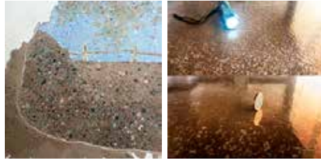
Pulido de hormigón en seco con distintas terminaciones