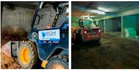
Preparación, nivelación, y compactación de soporte (base y sub-base)